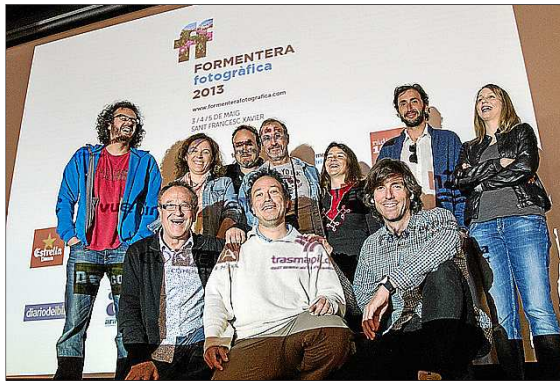
El equipo de las jornadas, al completo.